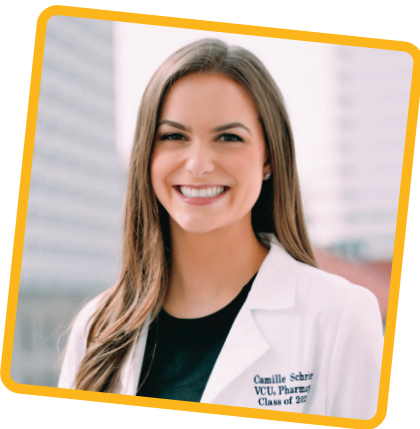
Camille Schrier, Miss America 2020

“Crecí amando la ciencia y decidí hacer un Doctorado en Farmacia. ¡Una vez que termine mi programa de estudio, espero combinar mi conocimiento clínico con experiencia empresarial para ayudar a dirigir una división dentro de una compañía farmacéutica como en la que empecé como interna!”