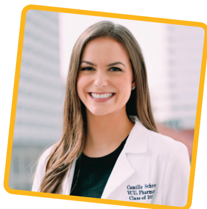
Camille Schrier, Miss America 2020

“Crecí amando la ciencia y decidí hacer un Doctorado en Farmacia. ¡Una vez que termine mi programa de estudio, espero combinar mi conocimiento clínico con experiencia empresarial para ayudar a dirigir una división dentro de una compañía farmacéutica como en la que empecé como interna!”